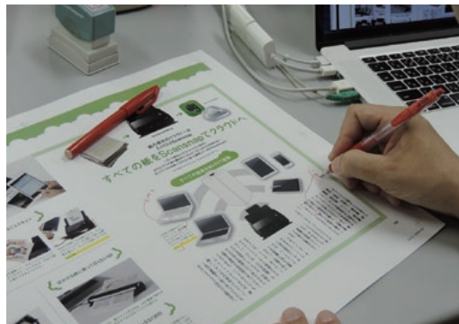
校正紙に赤字を入れる。 神経を研ぎ澄ませ、 時間と闘いながら作業 を進める。

ここで問題となるのが出力する紙（校正紙）の大きさだ。見開き単位で校正するため、一般的なA4判の雑誌なら校正紙はA3サイズ。赤字を入れたあと、普通のスキャナでは半分に切らないとスキャンできないため非常に手間がかかり、校了作業のブレーキになってしまう。だが「SV600」なら切らずにそのまま置くだけで「一発スキャン」が可能なので、効率が大きくアップするのだ。「それ以来、通常の進行でも『SV600』を校正に活用しています。もう手放せない、編集部の強力な武器です」