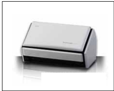
掲載商品（イメージスキャナ） FUJITSU スキャナ S1500

(*) エコ商品ねっと（環境の総合的な検索サイト） http://www.gpn-eco.net/index.php