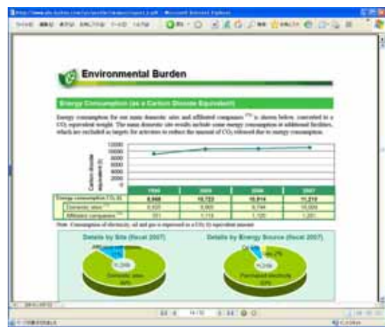
英語版環境報告書(PFU 公開ホームページ)