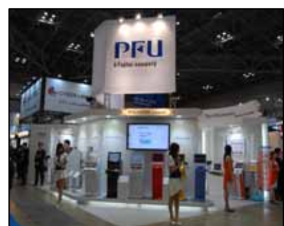
リテールテック JAPAN 2009