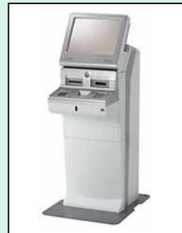
MEDIASTAFF EV モデル

環境負荷低減 総合処理能力の向上やリモート監視サービスの提供、保守性の向上などにより CO 2 の排出を削減し、環境負荷を低減