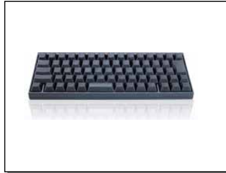
プロフェッショナルキーボード HHKB Professional JP シリーズ