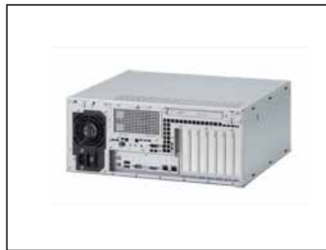
組込みコンピュータ AR8400 モデル 310F