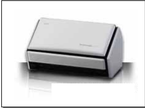
イメージスキャナ ScanSnap S1500

2008 年度は 47 製品をグリーン製品と認定し、出荷しました。1998 年度に最初のグリーン製品を出荷して以降、これまでに 483 製品をグリーン製品に認定しています。