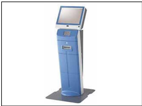
情報 K I O S K 端末 MEDIASTAFF ST モデル