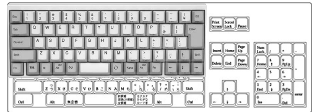
●図-2 フルキーボードとのサイズ比較●