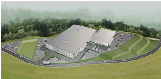
〔ProDeSセンターイメージ図〕

PFUは、IT 製品の開発製造支援サービス「ProDeS (Product Design Services)」の推進にあたり、お客様のご要望に一層のスピードをもってお応えする体制を整備するため、「ProDeS センター」を建設中です。今回は、6月下旬の完成に向けて急ピッチで工事が進むセンターの概要についてご紹介いたします。