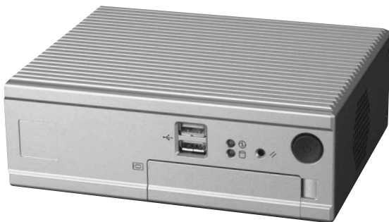
図 2 AR1000 シリーズ モデル 1500 外観 (Fig.2-Outside view of the AR1000 Series model 1500)

ファイアウォールなどのネットワークアプライアンス用途またはパソコン的な使い方。通常のパソコンでは足りないものを AR1000/2000 シリーズにおいて提