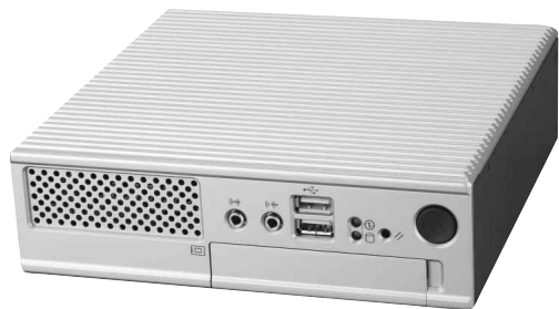
図 3 AR2000 シリーズ モデル 2500 外観 (Fig.3-Outside view of the AR2000 Series model 2500)

供する。差別化要因としては、小型化、ファンレス、HDD レス、LAN 多数ポート、長期供給や長期保守であり、価格的にも汎用 PC に対応すべく、機能を特化